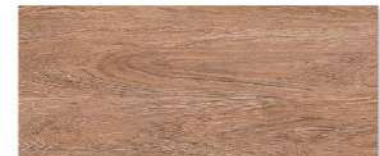
Teak Crown Grain/ สักมงกุฏ