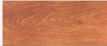
Mocha Omosia/ เมฆา