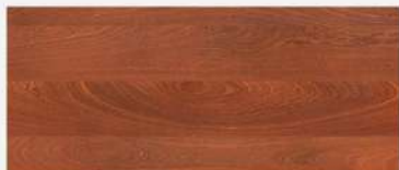
Mahogany/ ไม้ฮอกกาน้ำ