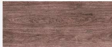
Walnut Oak/ ไม้ทวอสนัท