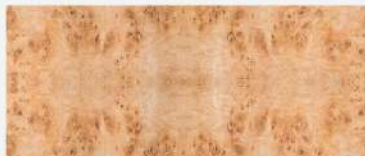
Mocha Burl/ ตาไม้เมฆา