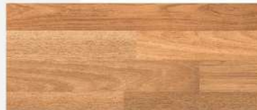
Caramel Parquet/ ปาร์เก้คาราเมล