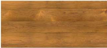
Gold Teak/ สักทอง