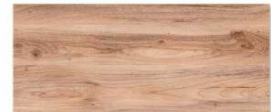
Brown Ash/ ไม้บ๊อบ