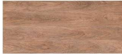
Teak Crown Grain/ สักทอง