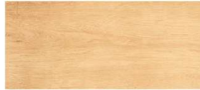
สักทองไร่/ Sak Tong Tae