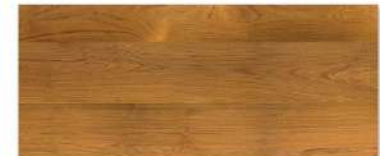
Gold Teak/ สักทอง