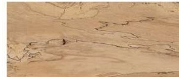
White Maple/ เบบี้