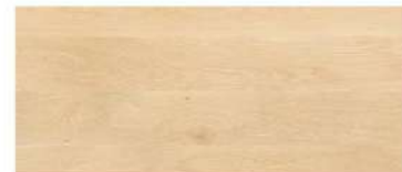
White Oak/ ไม้เอล์ม