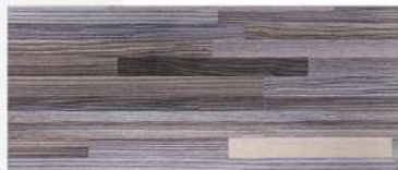
Grey Oak/ ไม้เทา