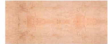
Birch Burl/ ตาไม้เบิร์ช