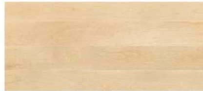
White Oak/ ไม้