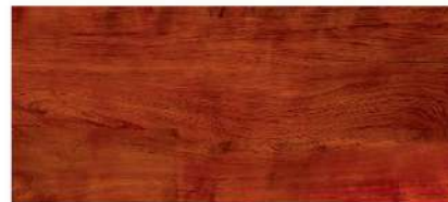
สักมงคล/ Sak Mong kol