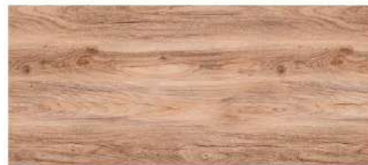
Brown Ash/ ไม้