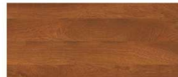
Padauk/ ไม้ประดู่