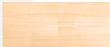
Honey Beech Parquet/ ปาร์เก้เก๋ฮัน