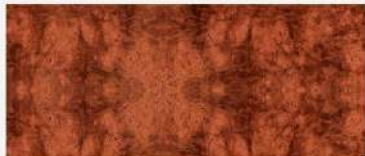
Red Padauk Burl/ ตาไม้ประดู่แดง