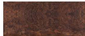
Walnut Burl/ ตาไม้ทวอสนัท