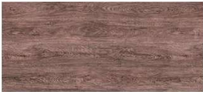
Walnut Oak/ ไม้กวนอู