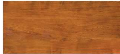
สักทองไร่/ Sak Tong Tip