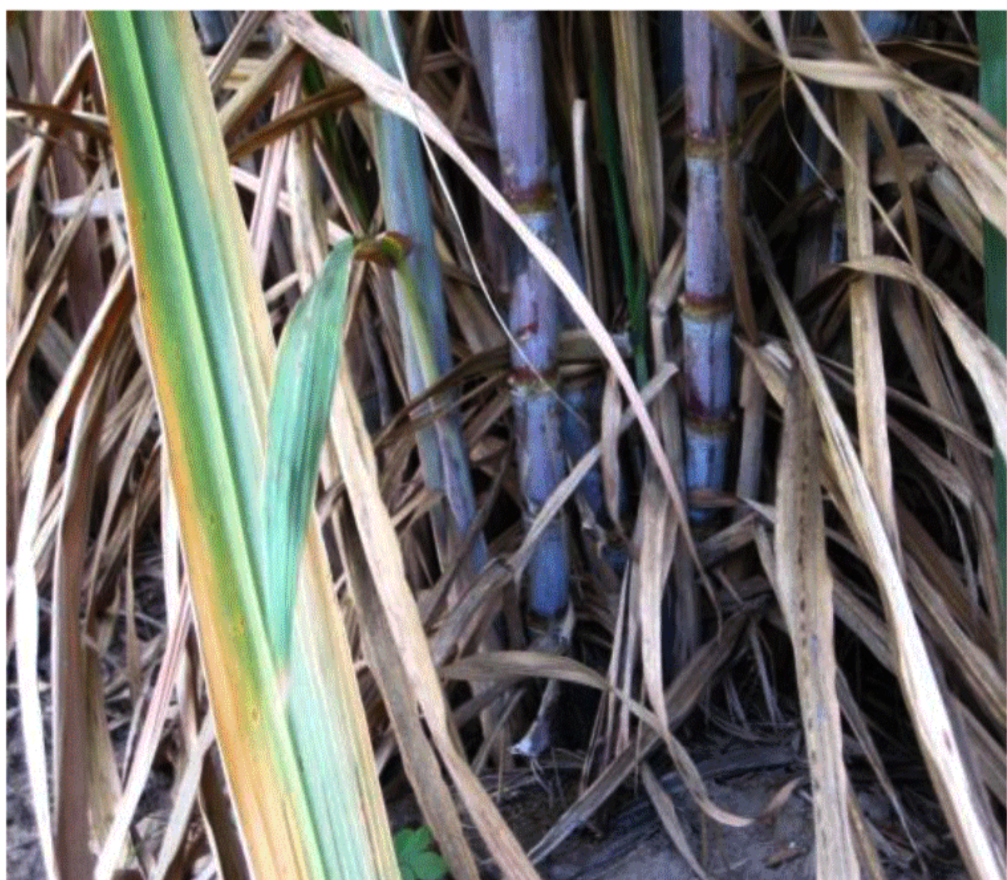
ต้นสมบูรณ์ ไม่ล้มง่าย