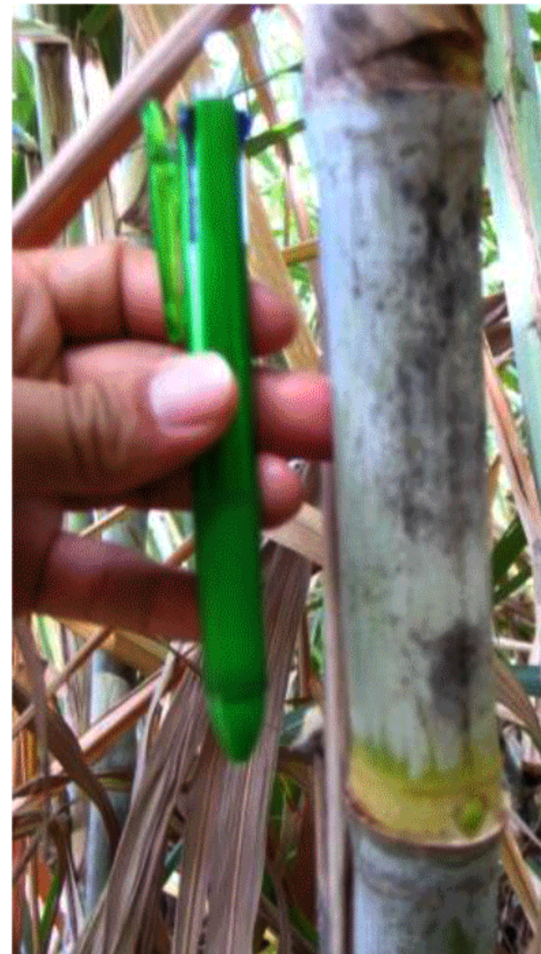
ตาใส ข้อปล้องยาว

ลดการใช้ปุ๋ยหลัก หรือปุ๋ยเคมีที่เคยใช้ ได้ถึง 30 %