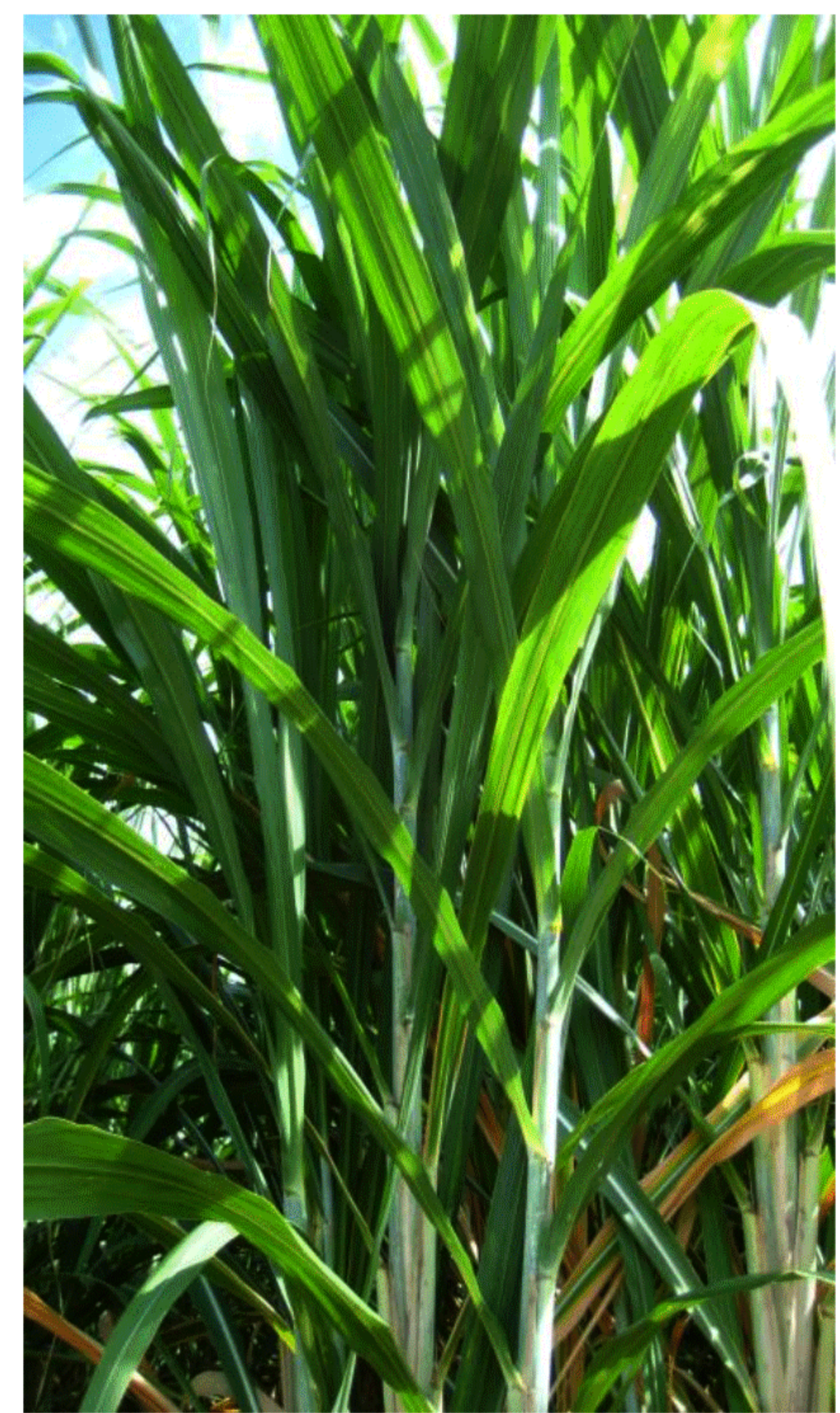
ใบเขียวตั้งตรง