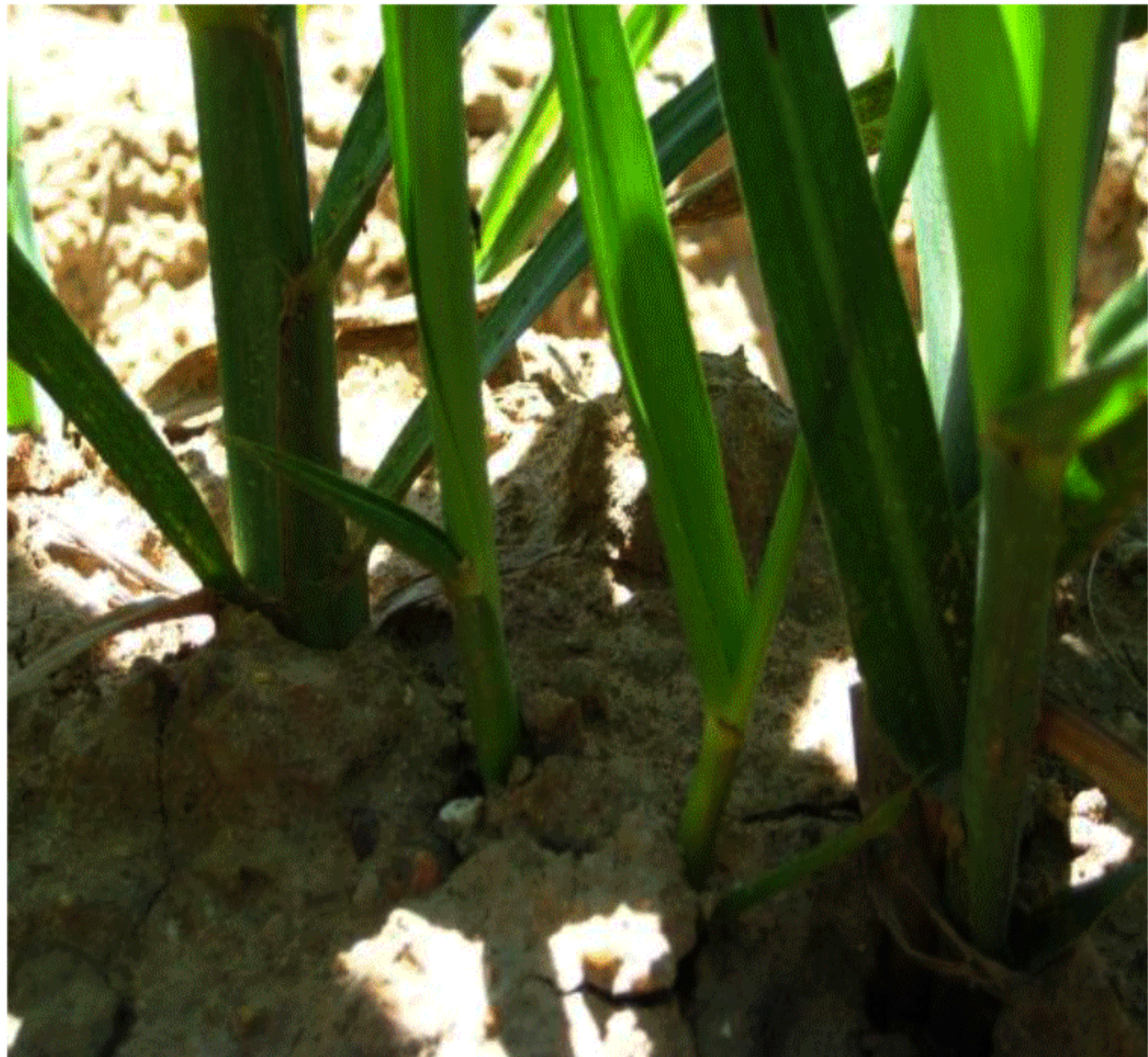
อ้อยที่แตกกอแล้ว ต้นตรงดี ช่วยให้อ้อยแตกกอดีเมื่อได้รับน้ำ/น้ำฝน