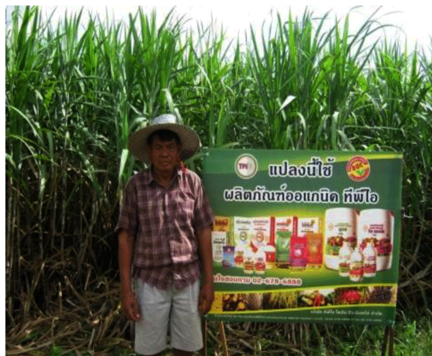
ช่วยเพิ่มธาตุอาหารรอง เช่น แมกนีเซียม แคลเซียม