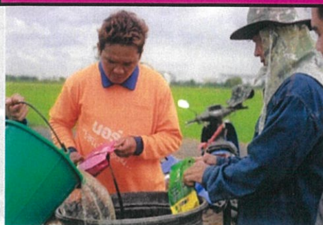
แต่ผสมน้ำแล้วฉีดพ่น

ปุ๋ยม่วง+น้ำส้มควันไม้ : ฉีดพ่นกระตุ้นการออกรวง เม็ดเต่ง ป้องกันแมลงรบกวน