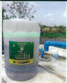
หรือจะปล่อยไปกับระบบน้ำ

ปุ๋ยแขวน : ใช้ง่าย มัดกับบรกลไค , ปล่อยบริเวณทางน้ำเข้า , ฉีดพ่นลงดิน