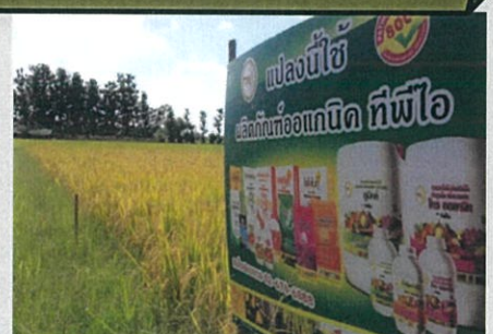
ผลผลิตปลอดภัย

ปุ๋ยม่วง+น้ำส้มควันไม้ : ฉีดพ่นกระตุ้นการออกรวง เม็ดเต่ง ป้องกันแมลงรบกวน