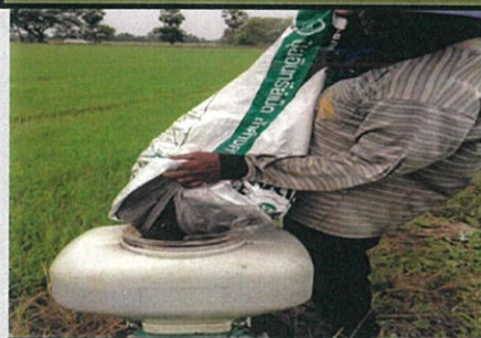
ใช้ได้กับเครื่องพ่นปุ๋ย

ปุ๋ยเม็ดกล้าดำงดาว : ธาตุอาหารครบถ้วน สะดวกใช้ ปลอดภัยต่อผู้บริโภค