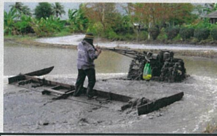
มัดปุ๋ยแขวนไปกับบรกลไค