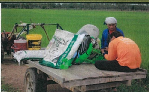
ธาตุอาหารครบถ้วน