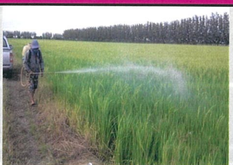
ไม่มีสารเคมีตกค้าง