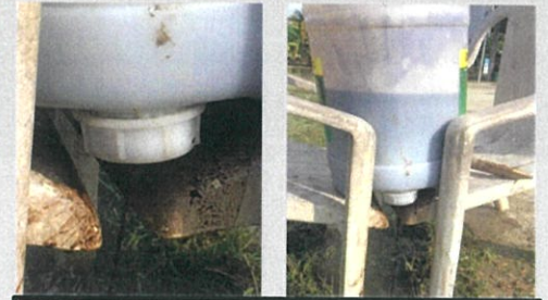
ปล่อยปุ๋ยลงทางน้ำเข้า

ปุ๋ยแขวน : ใช้ง่าย มัดกับบรกลไค , ปล่อยบริเวณทางน้ำเข้า , ฉีดพ่นลงดิน