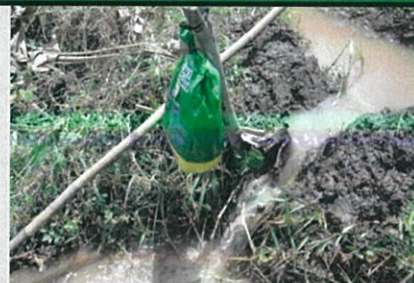
ใช้งานง่าย เกษตรกรคนเดียวก็สามารถใส่ปุ๋ยได้พื้นที่หลายไร่