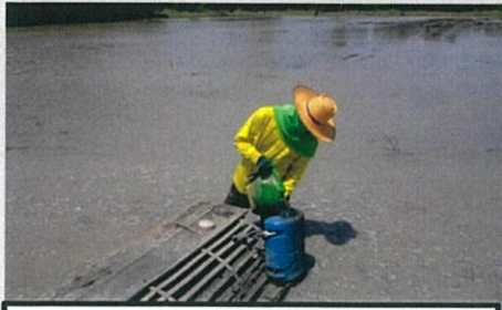
แต่ฉีดลงแล้วค่อย ๆ เท