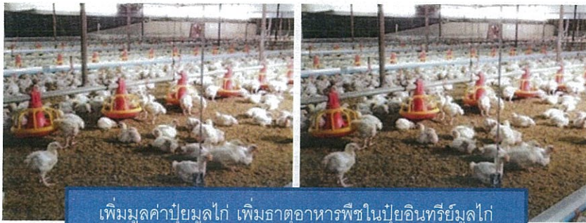
เพิ่มมูลค่าปุ๋ยมูลไก่ เพิ่มธาตุอาหารพืชในปุ๋ยอินทรีย์มูลไก่