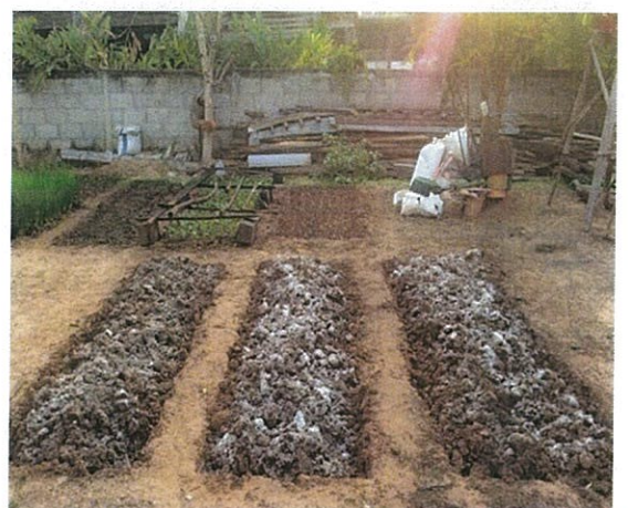
หลังจากจับไก่แล้ว นำปุ๋ยมูลไก่ มาเป็นปุ๋ยต่อไป