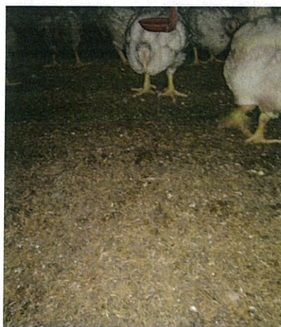
ปุ๋ยแกลบหนา 2-3 ซม. ให้ไก่ขบถ่ำ