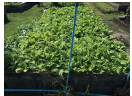
อายุพืช 25 วัน หลังย้ายปลูก