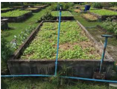
อายุพืช 10 วัน หลังย้ายปลูก